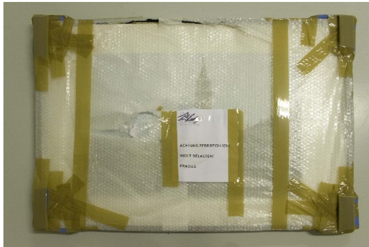
10. Totalschaden 10 2009 Transportschaden, vermutlich Durchstoß Gabelstapler; Cube Venice 2005 AP; Grafische Darstellung Farbe 75x50cm; gerahmt 102,5x72,5