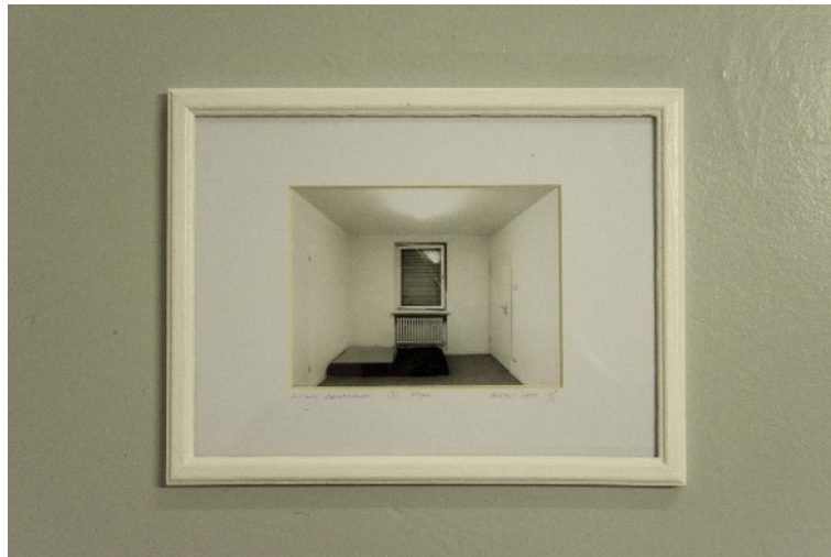
8. Totalschaden 8 2009 Schnitt; u r 1 u14 Schlafzimmer 1. Rheydt 1988 6/6; Foto sw 14x10cm; gerahmt 26x20cm